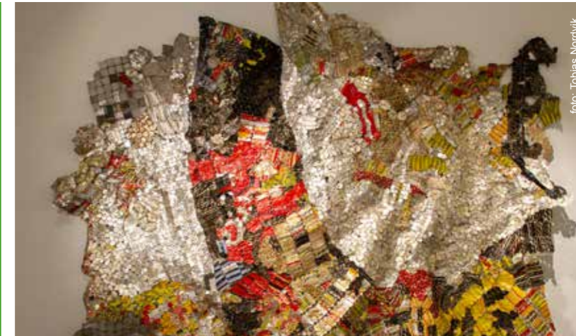
El Anatsui, Rehearsal, 450 x 450 cm. Veggskulptur laget av brennevinskorker og div. metall, sydd sammen med kobbertråd.

I Kunstbankens kunstbutikk presenteres et bredt utvalg av glass, smykker, keramikk, tekstil, grafikk og malerier av profesjonelle kunstnere fra Hedmark og landet for øvrig.