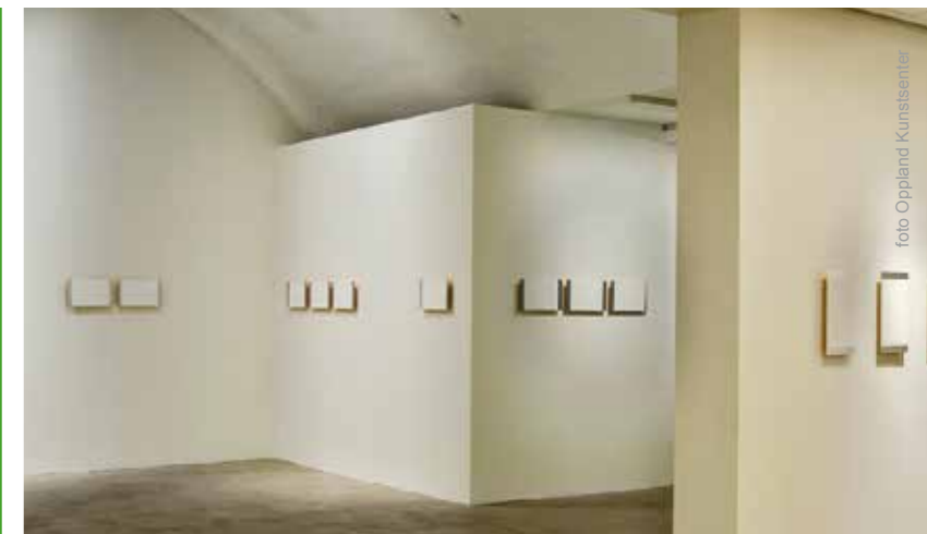
Fra utstillingen Elise Schonhowd "Memory as a creative act" Utstillingen var delt opp i tre sekvenser, del 2: installasjon med blindeskrift.